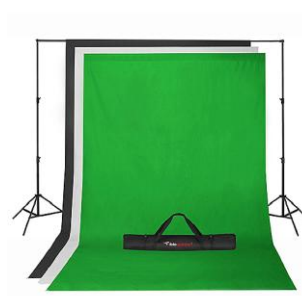
1 Porta Fundos de 3mt fundos em tecido branco, preto, verde croma key 3 x 7