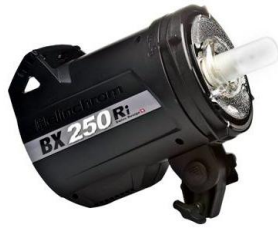
2 cabeças Elinchrom BXRi 250w