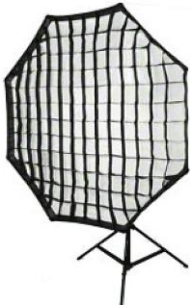
1 Softbox octogonal 150cm com gradeira