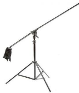
Girafa com contra- peso 120-220 cm