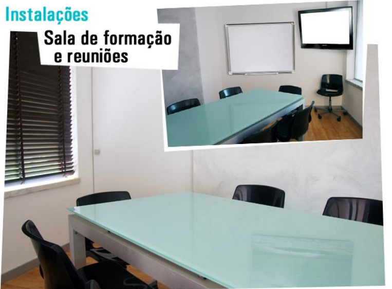
Sala de formação e reuniões