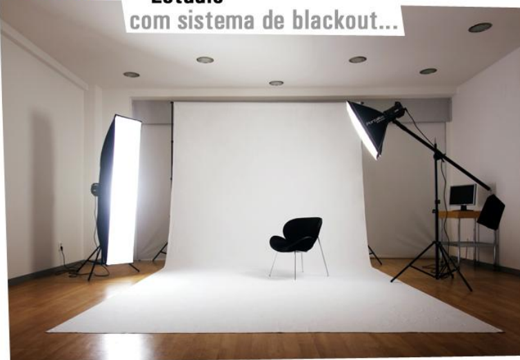
Estúdio com sistema de blackout...