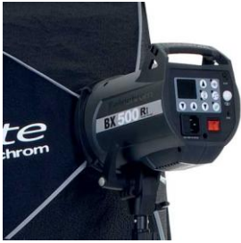
2 cabeças Elinchrom BXRi 500w