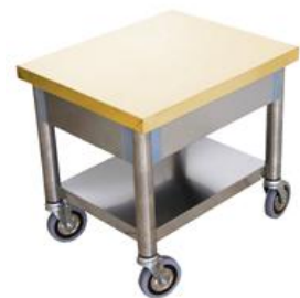
Mesa de apoio para pc portatil ou outro fim