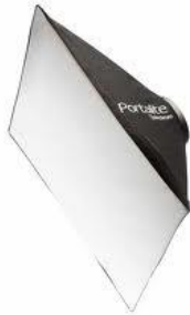
4 softbox 66 x 66