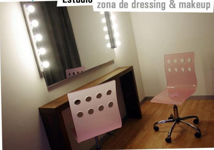
Estúdio zona de dressing & makeup