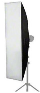
1 Stripbox 180 x 40