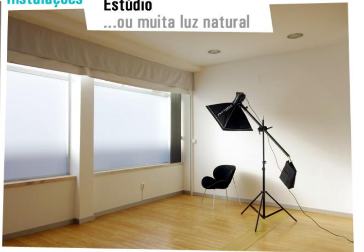
Estúdio ...ou muita luz natural