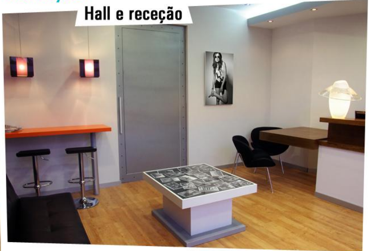
Hall e receção