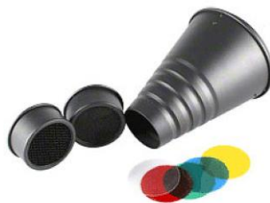
Snoot, 2 colmeias e filtros de cores