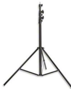
Vários tripés de apoio e suporte